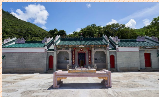
西貢佛堂門天后古廟