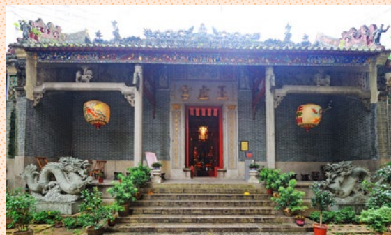
灣仔玉虛宮（北帝廟）